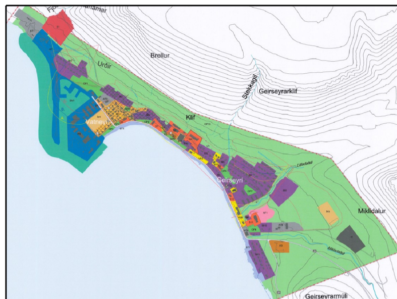
Þéttbýlisuppdráttur af Patreksfirði úr gildandi aðalskipulagi frá 2021.