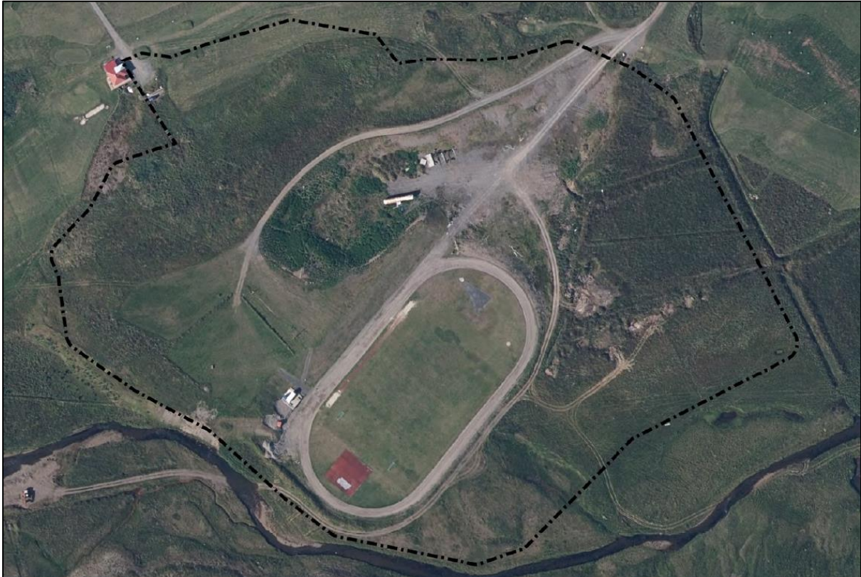
Mynd 2 - Mörk skráningarsvæðisins eru merkt á loftmynd með svartri punktalínu.