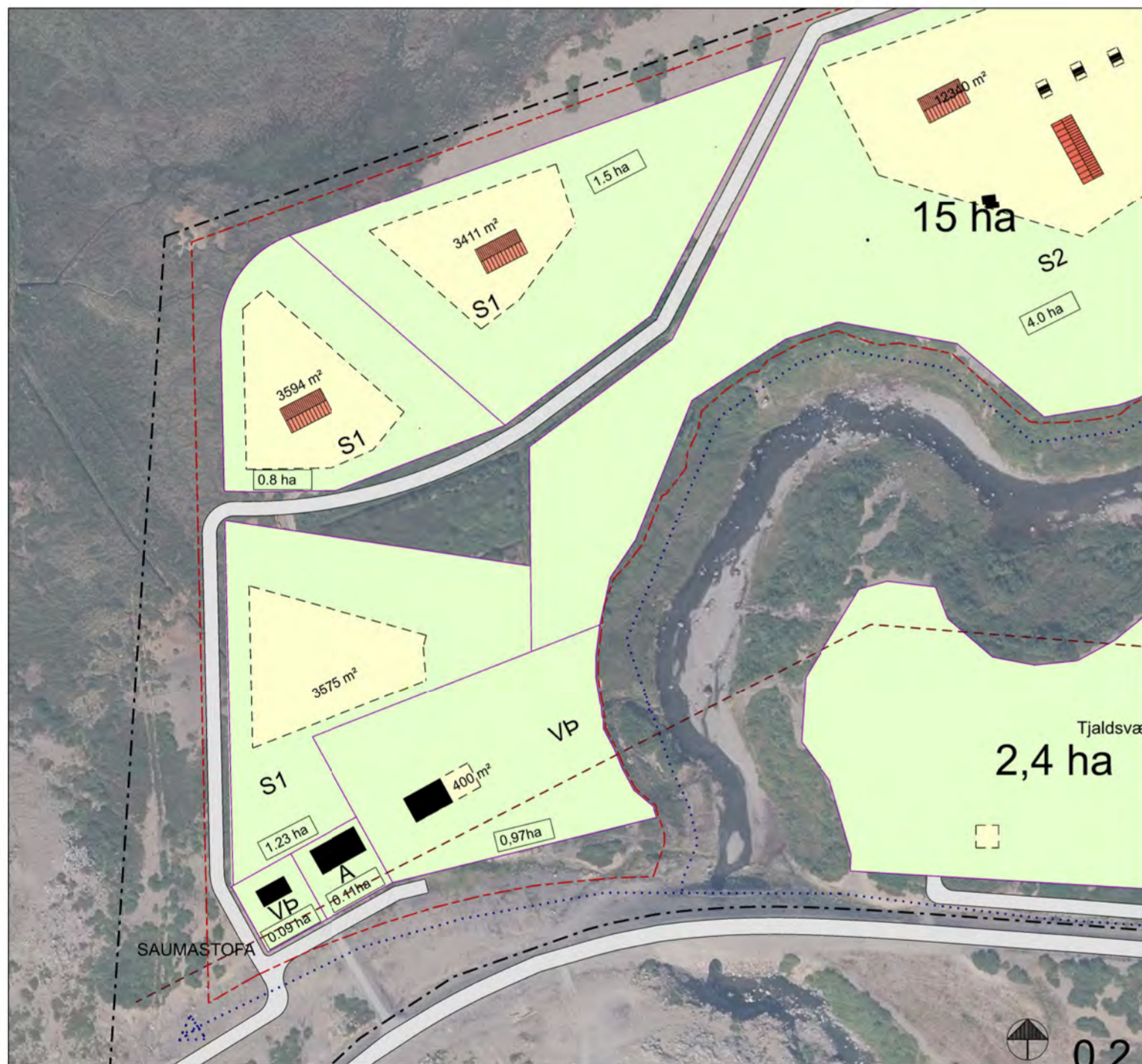
Breytt deiliskipulag, maí 2023