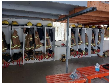
Mynd 4 Bíldudalur