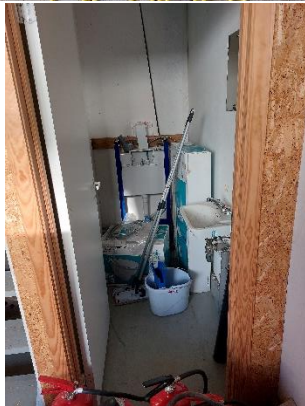
Mynd 7 Bíldudalur