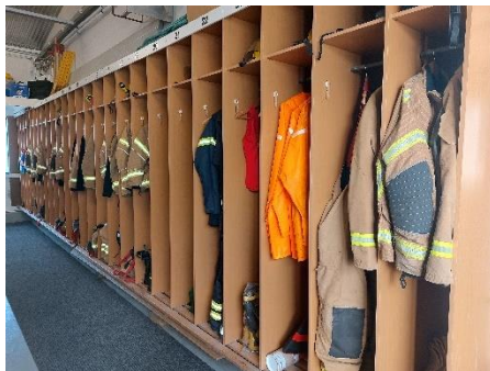
Mynd 3 Pateksfjörður