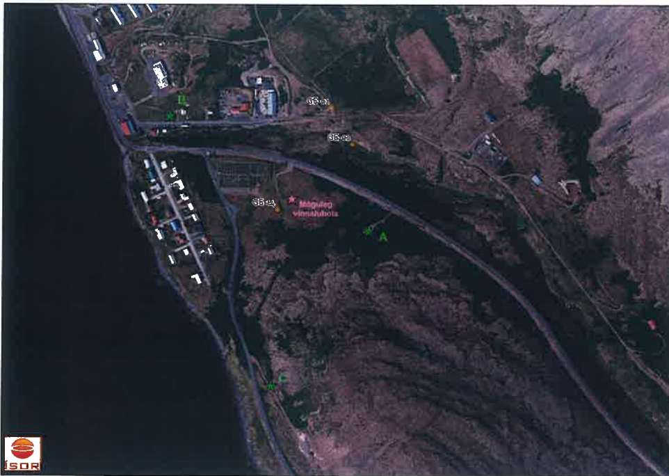
Mynd 1: Staðsetning nýrra borholna í Patreksfirði

Sótt er um leyfi til að bora eina vinnsluholu og þrjár rannsóknarholur. Holurnar eru merkar hér inná mynd 1 að neðan með stjörnum, fjólublá stjarna sýnir staðsetningu vinnsluholu og grænar stjörnur merkar A, B og C eru rannsóknarholur.